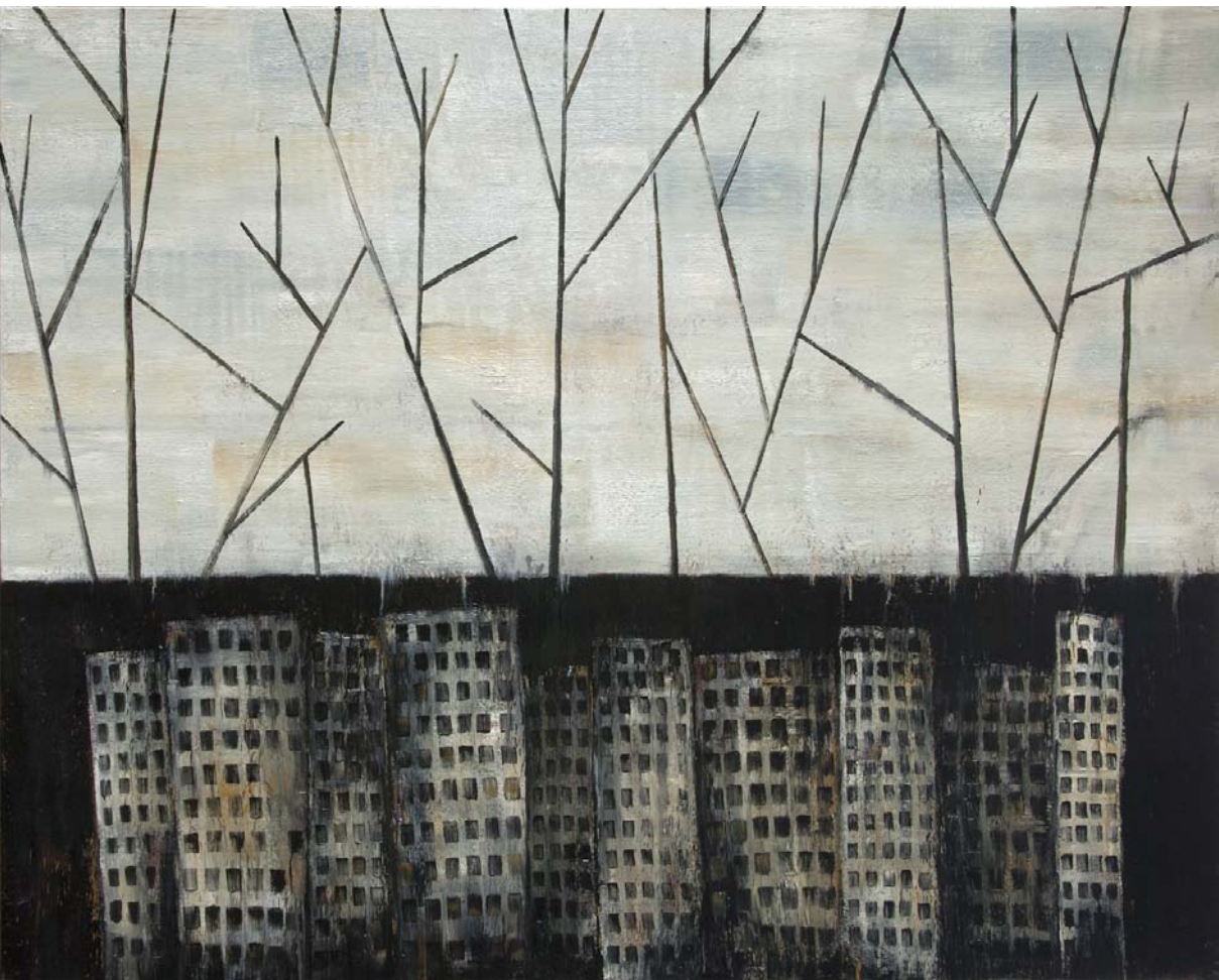
Archéologie, 2011, huile sur toile, 160 x 200 cm