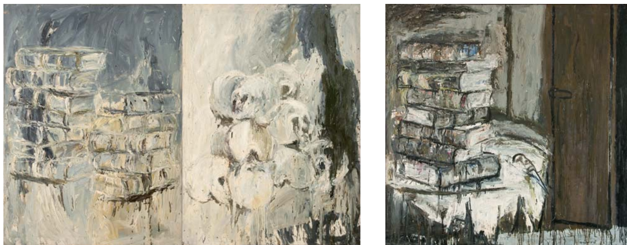
Sense títol 1985 130 x 194 cm Oli sobre tela (díptic)