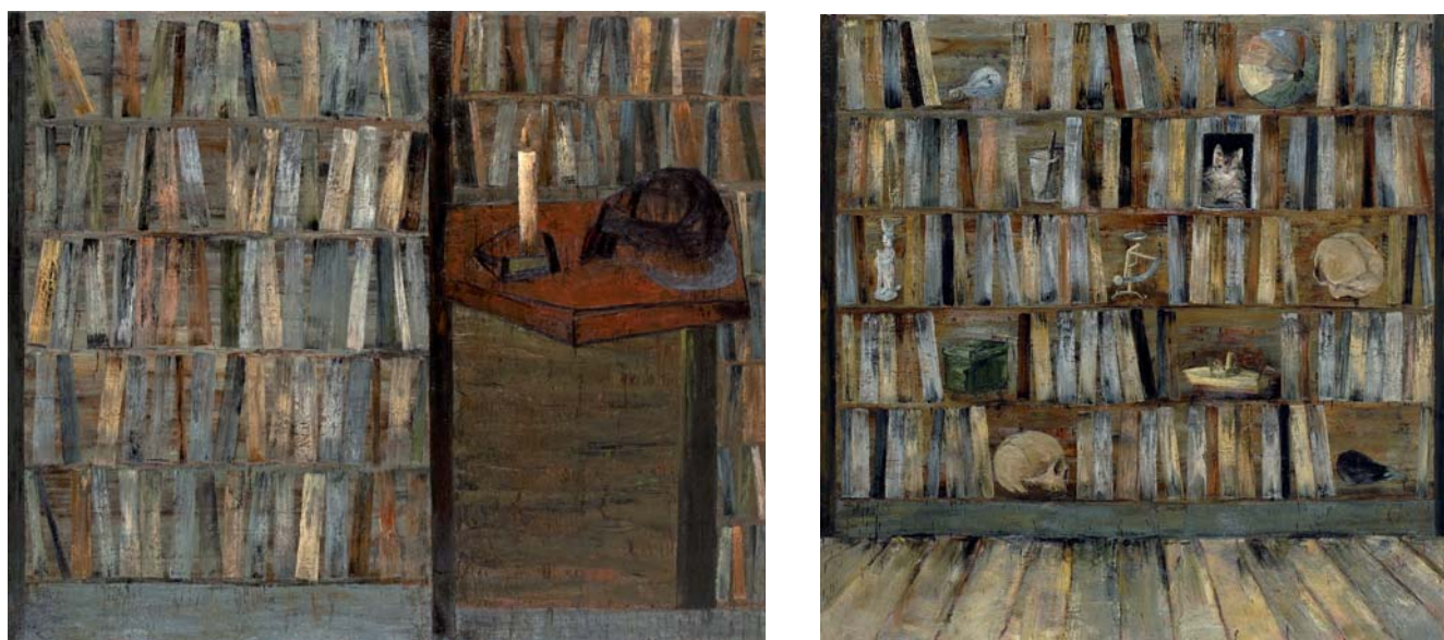
Biblioteca - 'Vanitas' 3 2006 200 x 240 cm Oli sobre tela