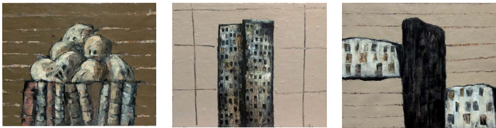
Fàbrica 2013 80 x 100 cm Oli sobre tela